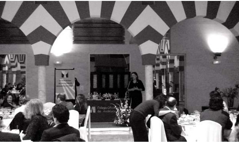
Presentación de la entrega de homenajes y distinciones

El pasado 1 de diciembre, en el hotel Al-andalus Palace de Sevilla, el Colegio Oficial de Psicología de Andalucía Occidental celebró una Cena Colegial en la que se homenajearon y entregaron distinciones a distintas personalidades del campo de la Psicología, así como a instituciones en razón de su aportación a este campo.