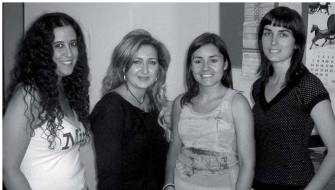
Trabajadoras del proyecto e-Andaluzas en la Sociedad Red

El proyecto e-Andaluzas en la Sociedad Red , enmarcado en el eje IV de la Iniciativa Comunitaria EQUAL (Igualdad de oportunidades), pretende contribuir a que la sociedad andaluza de la información se convierta en una plataforma decisiva para el impulso de la igualdad laboral entre hombres y mujeres dentro de nuestra comunidad autónoma.