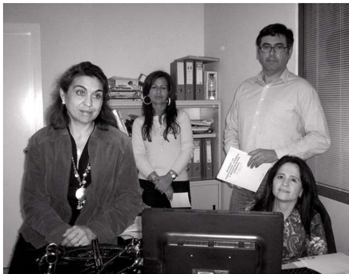
Equipo técnico del proyecto

En los primeros días se procede a establecer el protocolo de actuación tanto a nivel técnico como a nivel administrativo, a la vez que se delimita el procedimiento a desarrollar.