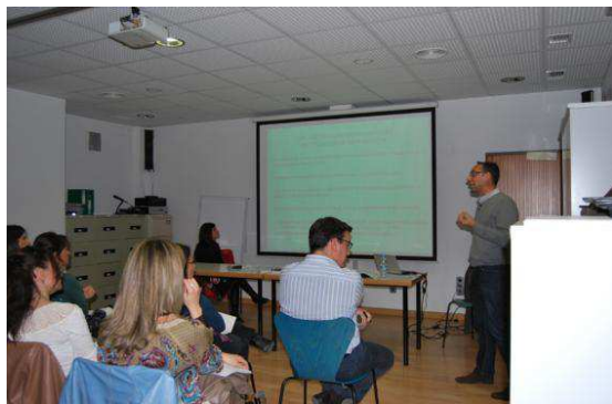
Debate Reflexivo sobre evaluación psicológica en personas mayores